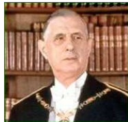
Charles de Gaulle